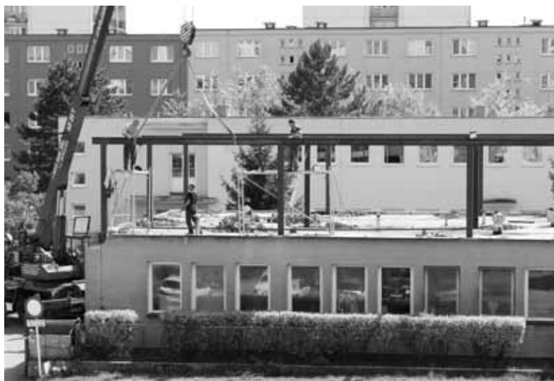
Přístavba stávající mateřské školy.

ZM revokovalo bod č. 23 Usnesení Zastupitelstva města Odolena Voda č. 5/2009 ze dne 21. září 2009 ve věci „Využití nebytového prostoru v č. p. 253–254 (bývalého železářství) na Horním náměstí v Odoleně Vodě pro kulturní účely města a zastavení dalšího komerčního pronájmu těchto prostor“ a doporučilo radě města zveřejnit záměr na pronájem těchto prostor společnosti CVS2000 spol. s.r.o, Praha 9, která o něj projevila zájem, za účelem provozování prodeje zaměřeného na sortiment železářství, zahrada, barvy, instalatérské a domácí potřeby.