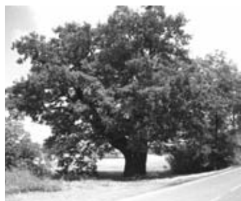
Památný strom před úklidem a po úklidu.