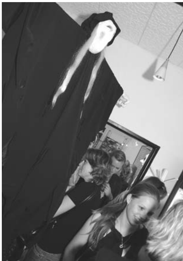
Výstava „Divnoobjekty“ studentek a žáka ZUŠ Klecany zaplnila Minigalerii od 4. - 27. 6.