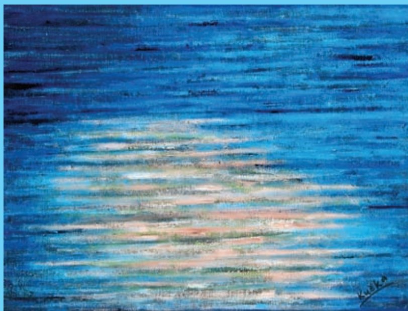
Vibrace věčnosti – olej na plátně 45x60 cm