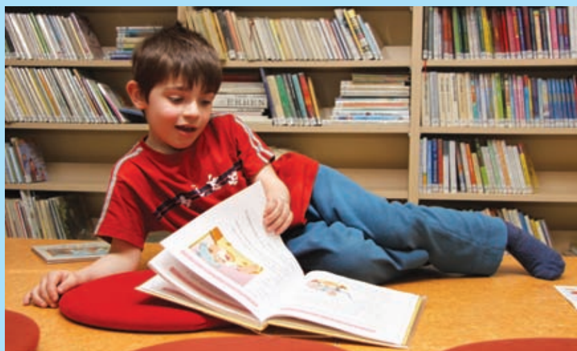
Březen – měsíc knihy, návštěva dětí z mateřské školy v místní knihovně.