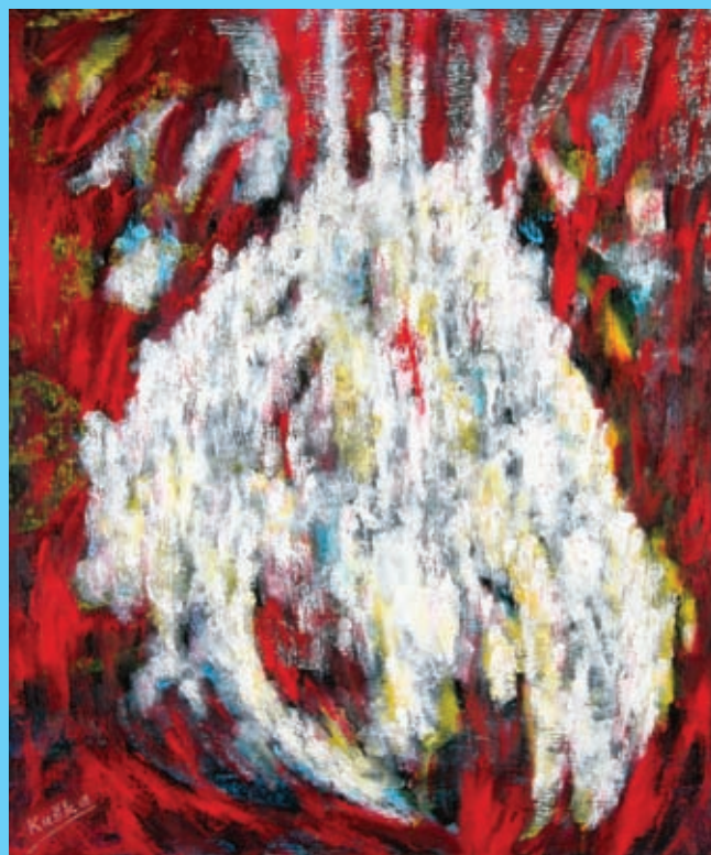
Anděl – olej na plátně 55x45 cm