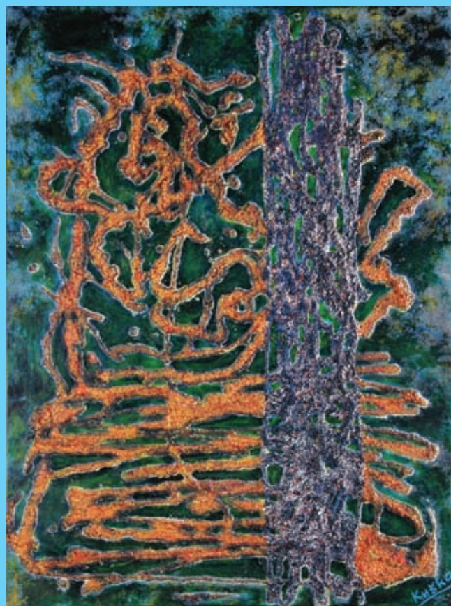
Kmen – kombinovaná technika na plátně 70x50 cm

Titul: Velký háj, Odolena Voda – kombinovaná technika na plátně 50x70 cm