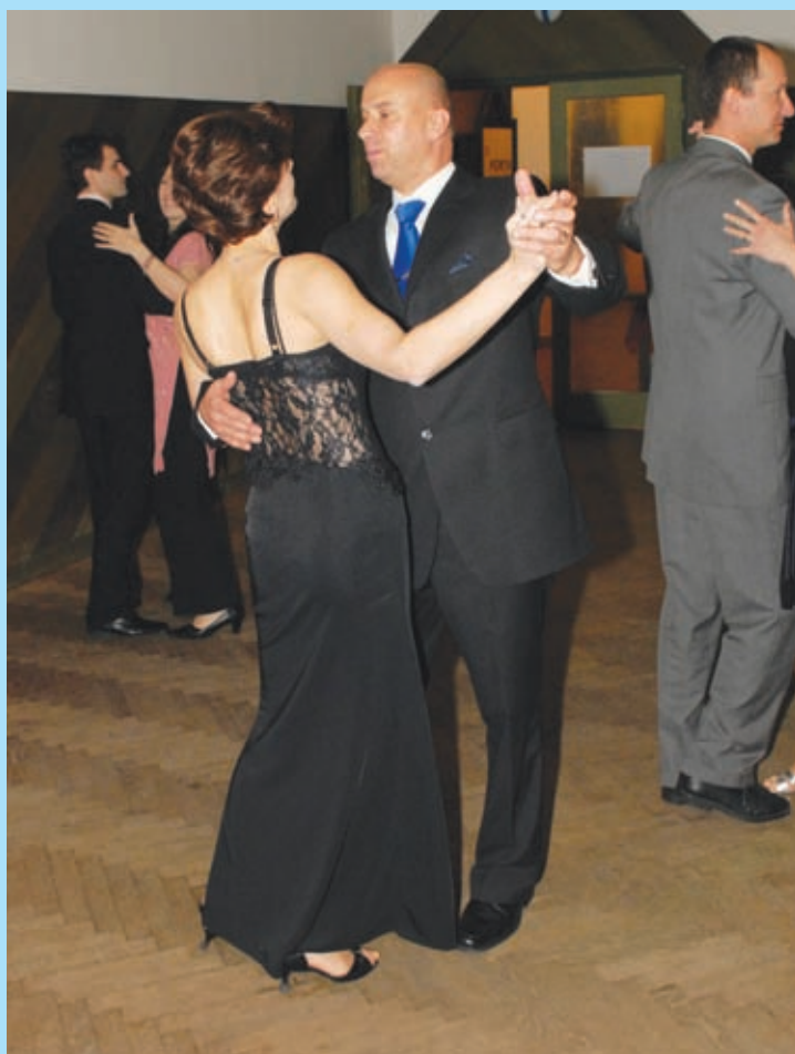
Jarní ples ODS, 19. března, Klub Aero.