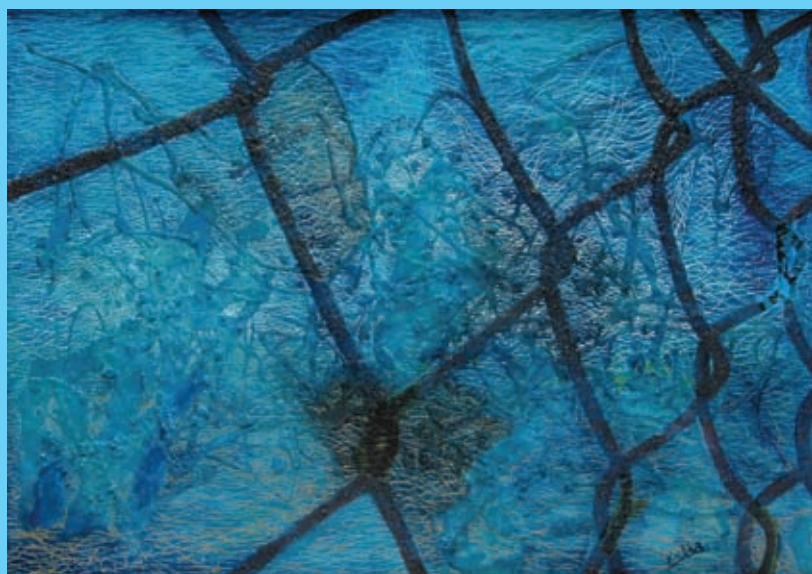
Důležitý detail – kombinovaná technika na plátně 45x65 cm

Za celou dobu, kdy jsem v Odoleně Vodě, vznikl můj velmi hluboký vztah nejen k tomuto místu, ale i k lidem, okolí, a to má pro mne nenahraditelný tvůrčí význam.