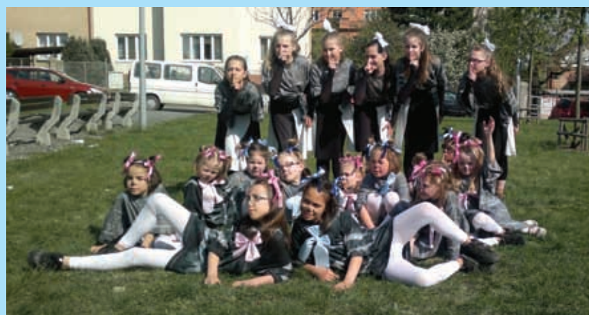
Taneční skupina Vodolenka se 16. dubna zúčastnila soutěžní Přehlídky scénického tance v Salesiánském divadle v Kobylisích.