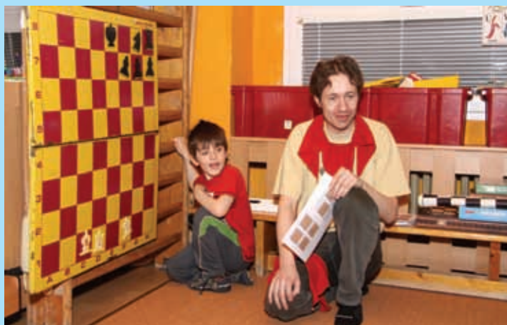
Obrácený den aneb Apríl ve školce, Mateřská škola Odolena Voda, 1. dubna.