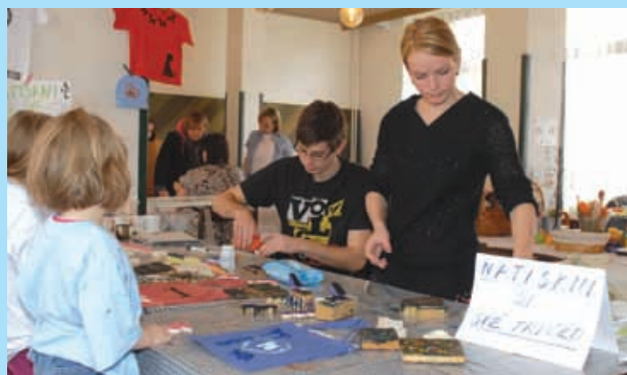
Jarní tvoření, Klub Aero, 26. března.