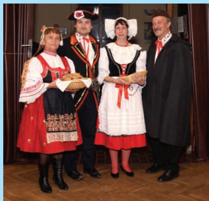
Sousedská zábava, restaurace Opera v Dolínku, 9. dubna.