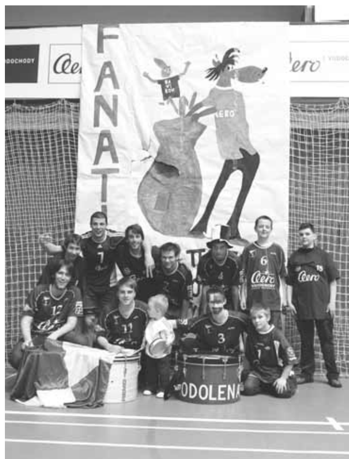
Fanoušci volejbalového týmu při posledním utkání předkola play-off extraligy.