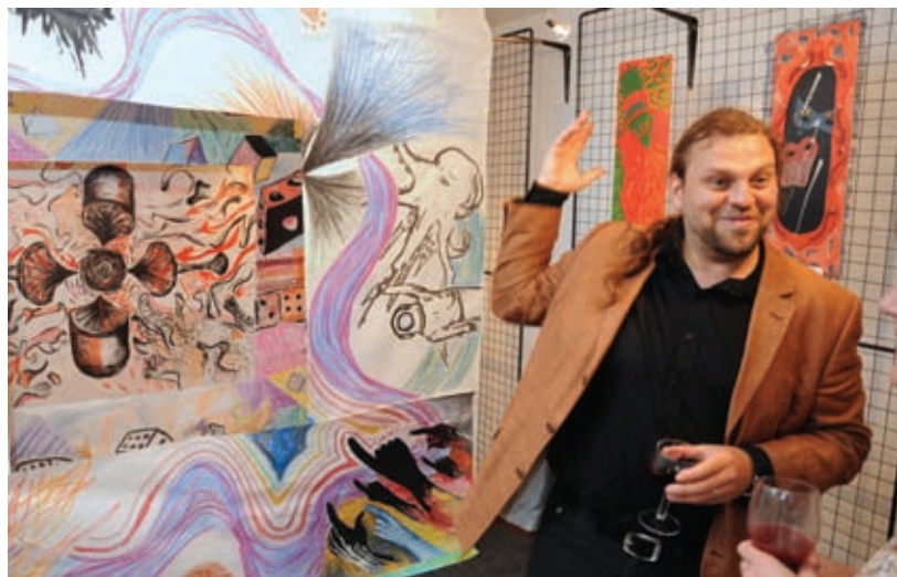
Vernisáž ESCAPE, Minigalerie, 3. 6.