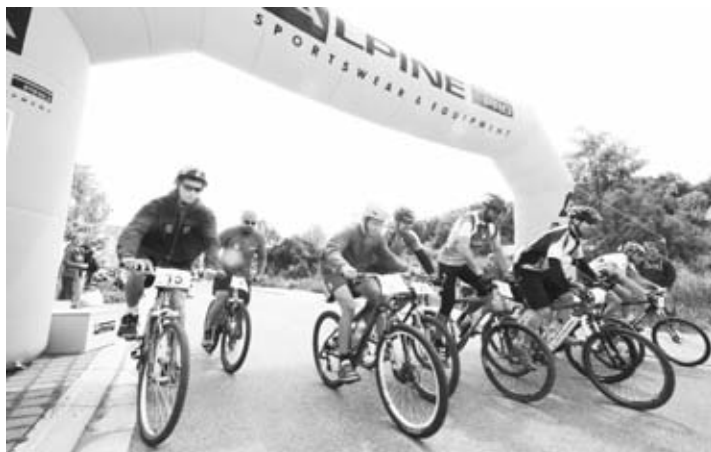
Cyklistický závod v Odoleně Vodě nejen do kopce a z kopce, 19. 6.