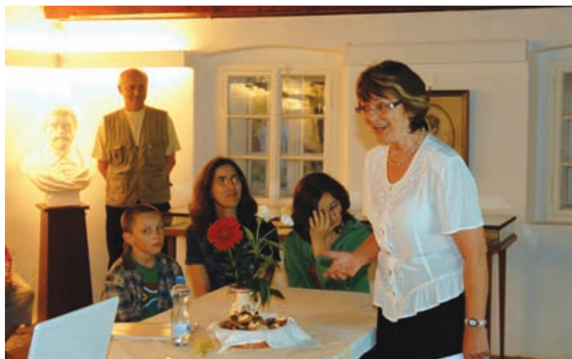
Muzejní noc, rodný domek Vítězslava Háška v Dolínku, 4. 6.