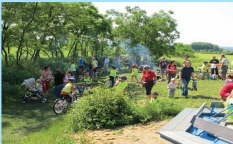
Bezpečně na kolech, 11. 6.