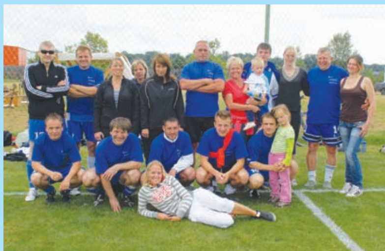
Sousedé se spolu baví v Dolním Povltaví, hřiště Sokola Klíčany, 28. 5.