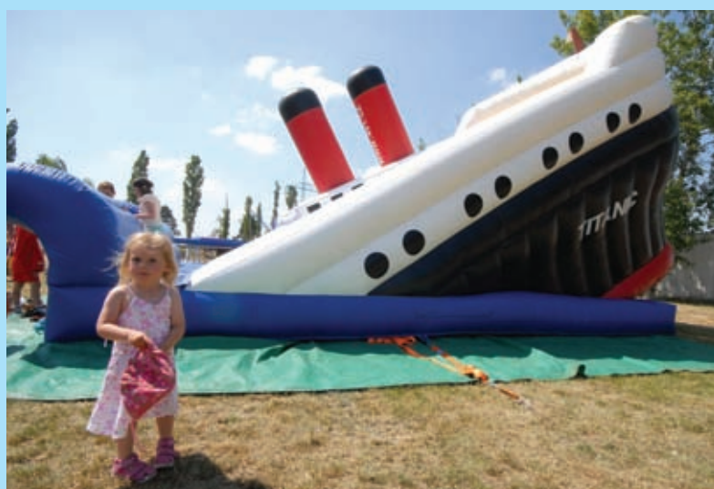
Dětský den, areál sportovní haly, 4. 6.