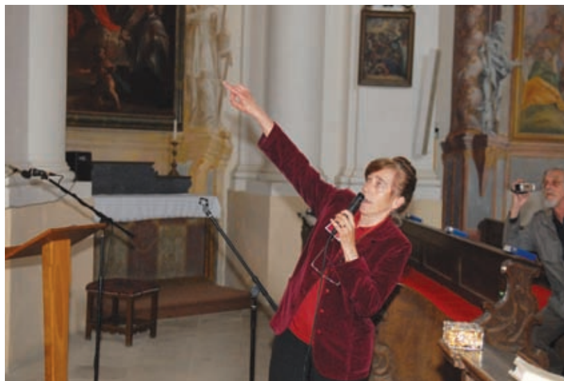
Noc kostelů, kostel sv. Klimenta, 27. 5.