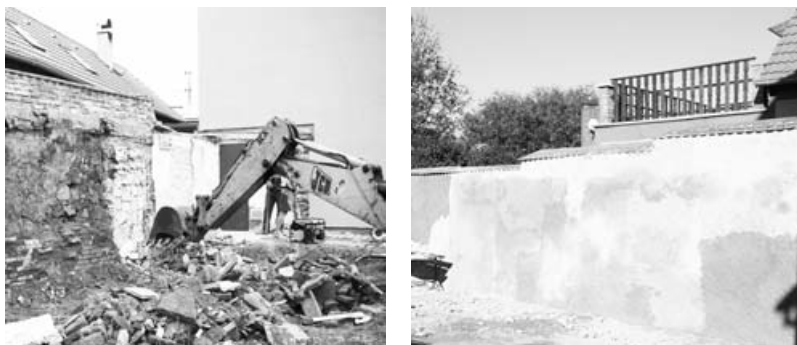
Zahájili jsme rekonstrukci staré nevzhledné zdi za stavebním úřadem. Fotografie dokumentují stav před a po rekonstrukci.