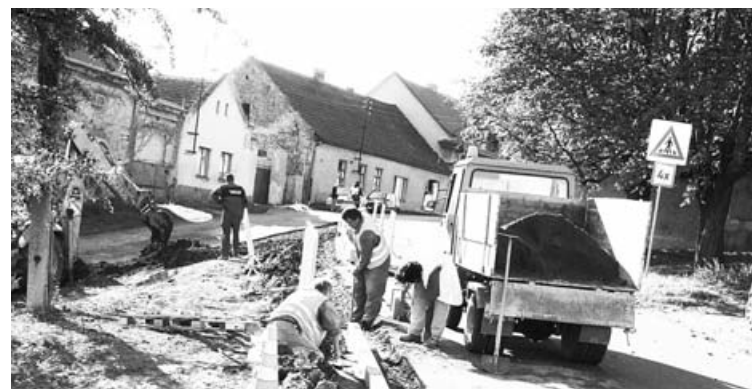
Oprava parku v Růžové ulici. Provádějí technické služby ve spolupráci s komisí pro životní prostředí a zahradnicí Pavlou Češkovou.