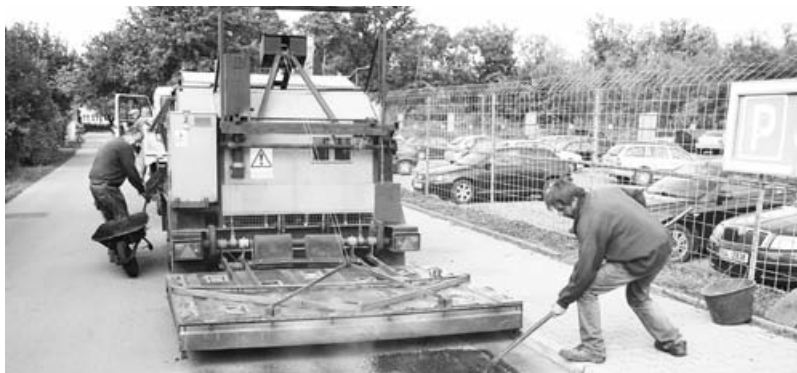
Oprava vozovky u základní školy.