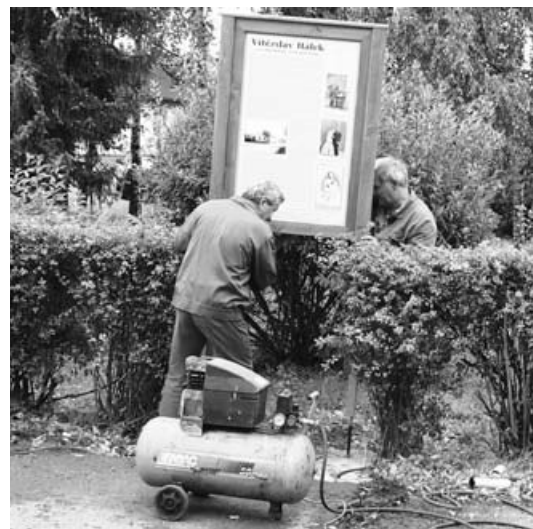
Montování panelu V. Hála. Díky za práci patří technickým službám.