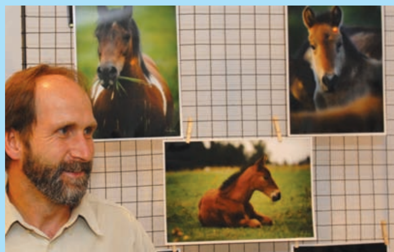
Vernisáž Tomáš Vainer – Koně, Minigalerie Odolena Voda, 6. 10.