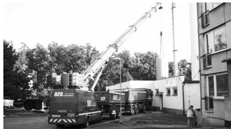
Instalace nových nádrží rekuperační jednotky prováděná s pomocí jeřábu. Pro zajímavost pár technických údajů: jedna nádrž váží 15 tun, jeřáb váží 170 tun a jeho maximální nosnost je 350 tun.