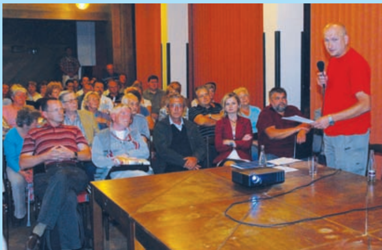
Diskuse k záměru rozšíření Letiště Vodochody, 4. 10.