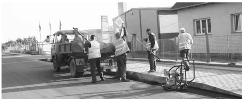
Oprava zastávky Vodolská v Dolínku, provádějí technické služby.