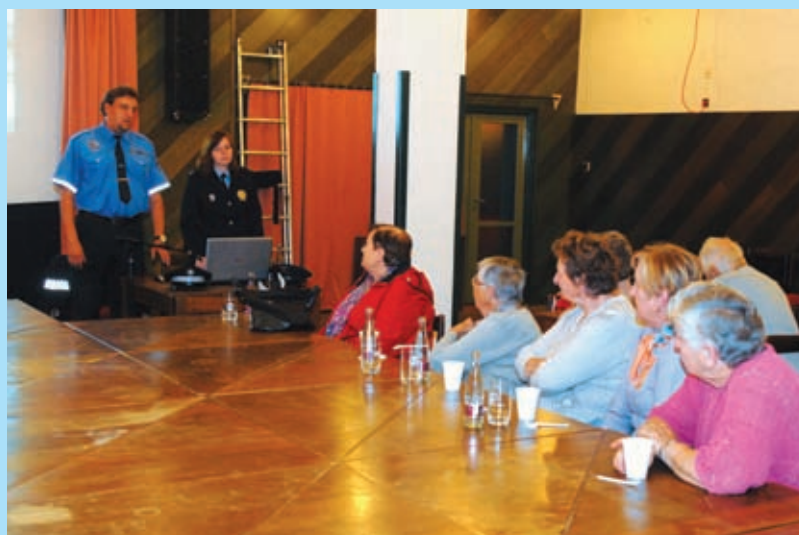
Přednáška Bezpečnost pro seniory, 12. 10.