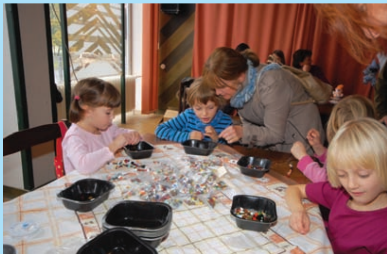
Podzimní tvoření na Odolce, 22. 10.