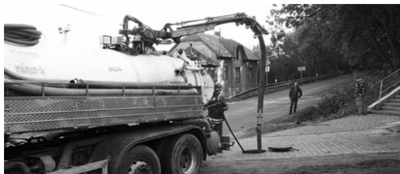
Město Odolena voda se připravuje na zimu, probíhá tlakové čištění dešťové kanalizace.