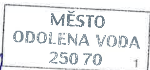
Hana Plecítá starostka Města Odolena Voda